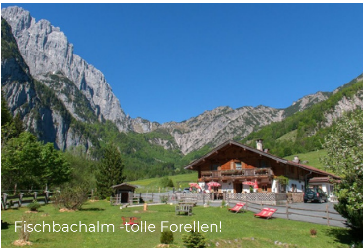
Fischbachalm -tolle Forellen!