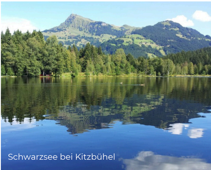
auf Höhe Rangental

Die Sportregion: Wandern, Schwimmen, Radfahren, Golfen ... und dann gut Essen