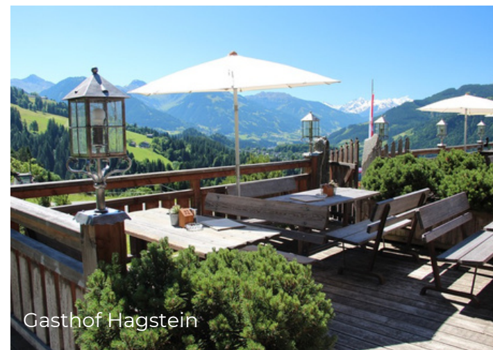
Stuckkogel-Runde auf der Bichlalm